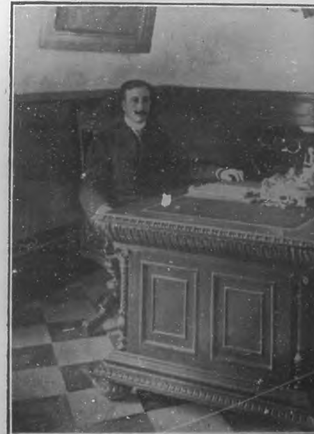
DR. ORESTES FERRARA Presidente de la Cámara