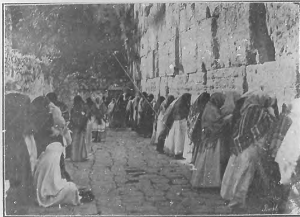
EL LLANTO DE LOS JUDIOS

N. de R.—Las fotografías que ilustran el presente artículo, son debidas á la galantería de los PP. Franciscanos, en la Habana establecidos.