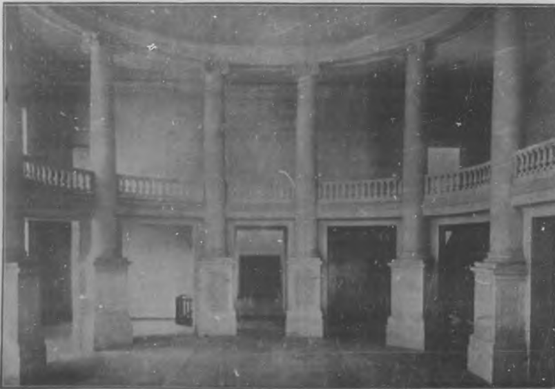
SALÓN DE SESIONES DE LA CÁMARA DE REPRESENTANTES, COMO FUE ENTREGADO AL CESAR EL GOBIERNO PROVISIONAL.

Representantes, recorrió las Ciudades de Europa; y en el estudio y de observación, visitó los Parlamentos de España, Francia, de Inglaterra y de los Estados Unidos.