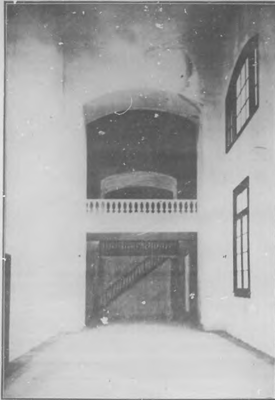
SALÓN DE CONFERENCIAS DE LA CÁMARA DE REPRESENTANTES COMO FUE ENTREGADO AL CESAR EL GOBIERNO PROVISIONAL.