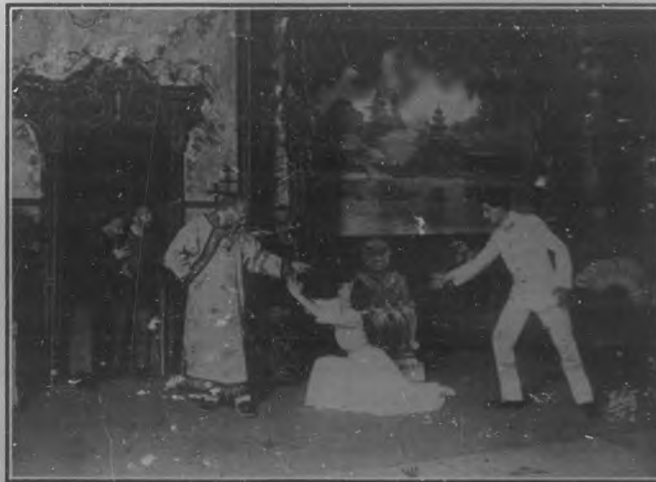
Una escena de "La Hija del Mandarín" pantomina puesta en escena en Payret por la notable compañía de Molinos.

¡Ojalá que aquellos puedan prestar beneficios positivos á los dolientes, desde un gabinete de cirugía dental dirigido por el notable cirujano que se instala pronto! Son los descos