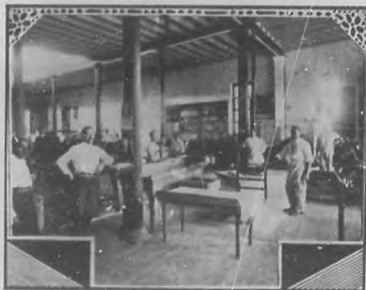
Sección de fabricación y preparaciones.