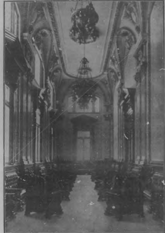
SALÓN DE CONFERENCIAS DE LA CÁMARA, TAL COMO HA SIDO ALHAJADO.