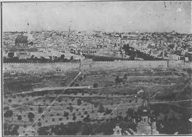
VISTA DE JERUSALÉN

entusiasmo, con fé y admiración. Jesús toleró tamaña ovación porque con ella se proclamaba la verdad que los fariseos se obstinaban en negar. Era menester aplastar á éstos y dar satisfacción á las conciencias creyentes.