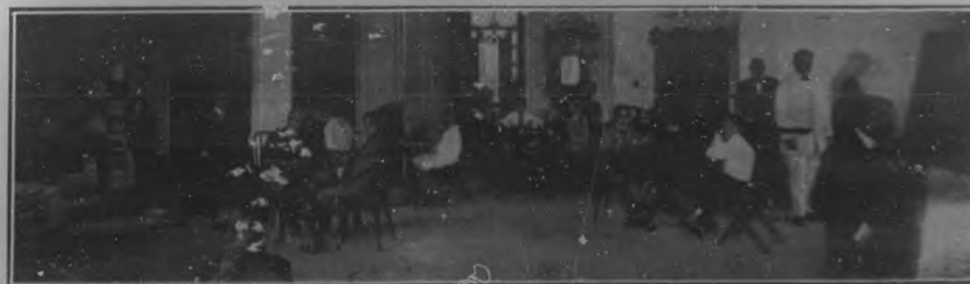
Torneo infantil de ajedrez.—Pequeños futuros "grandes" jugadores estableciendo partidas en el Club de Ajedrez.