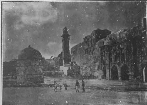
LA FORTALEZA ANTONIA